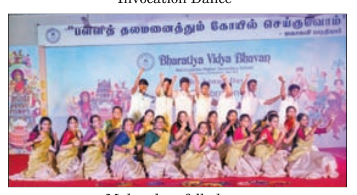
Malayalam folk dance