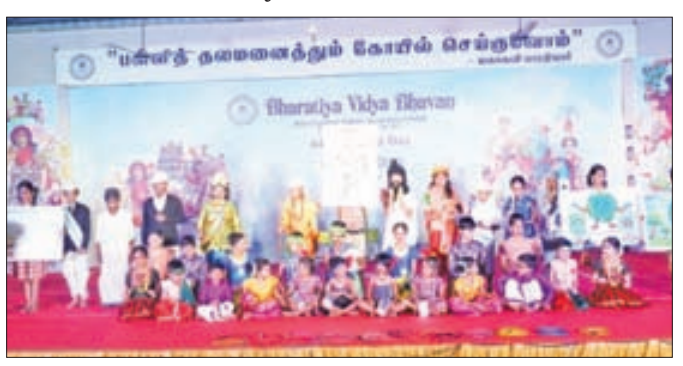
Glory to Tamilnadu - Tableau

The source of vision is inspiration. The source of inspiration is passion. The source of passion is purpose – Anon