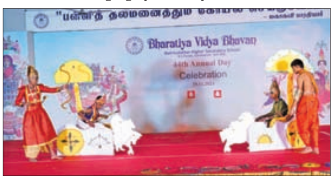
Skit on Karna