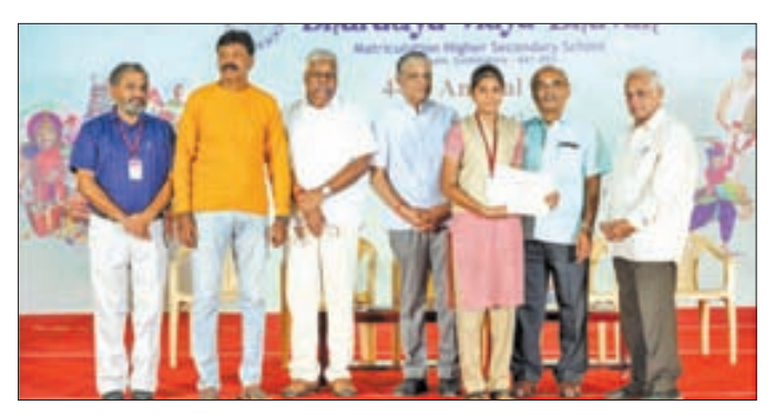
Distribution of C. Subramaniam Award.