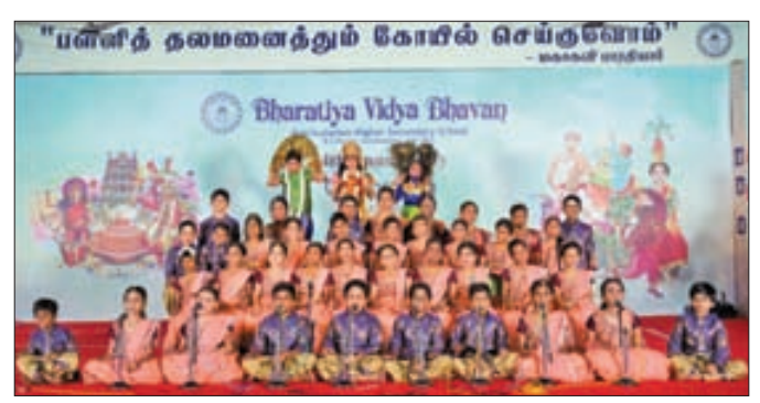
Singing by Primary Choir