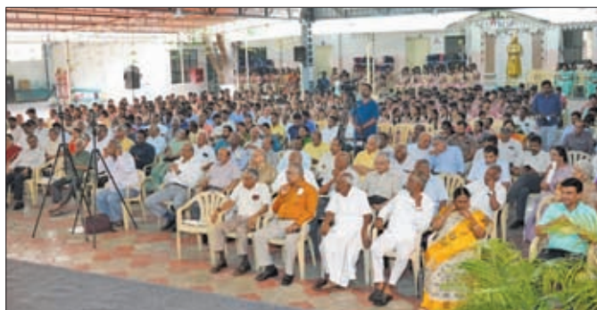
A Section of the audience

in raising the water table in the region, and emphasized the necessity of continued efforts in the region's water conservation. He also appealed to the community to support Siruthuli as it celebrated 21 years of tireless service.