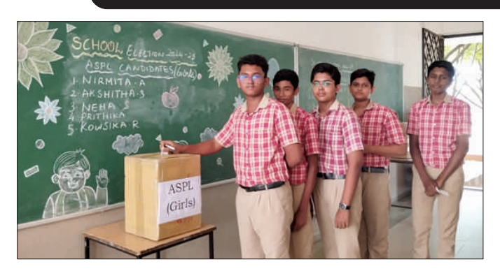
"Voting is not only our right, it is our power"

We at Bhavan conduct Student Council Election every year because we understand that the students of today are the learders of tomorrow.