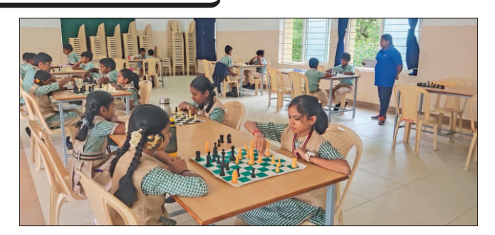
House clinched the 1st position in the boys' category, while Valluvar House secured the top spot in the girls' category.

"The true hero is one who conquers his own anger and hatred."