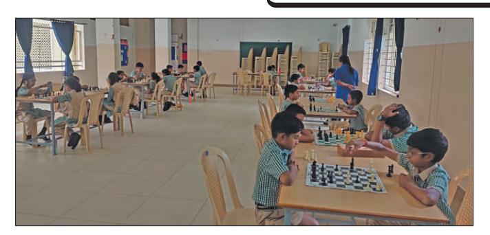
The Chathurangam tournament at Bhavans featured the Inter-house Chess competition in celebration of International Chess Day. Bharathiar