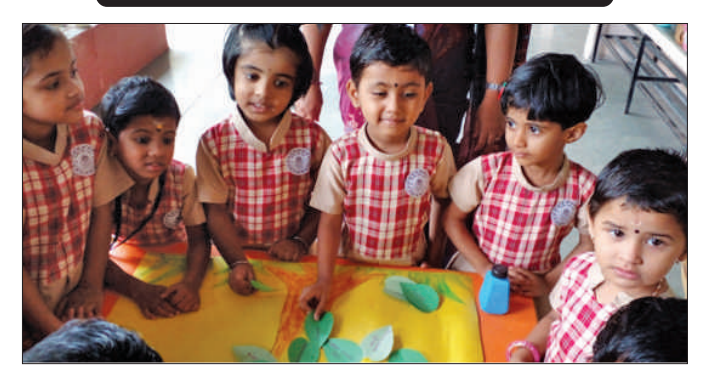
To develop psycho motor skills of the kids activities are given regularly for KG Classes.