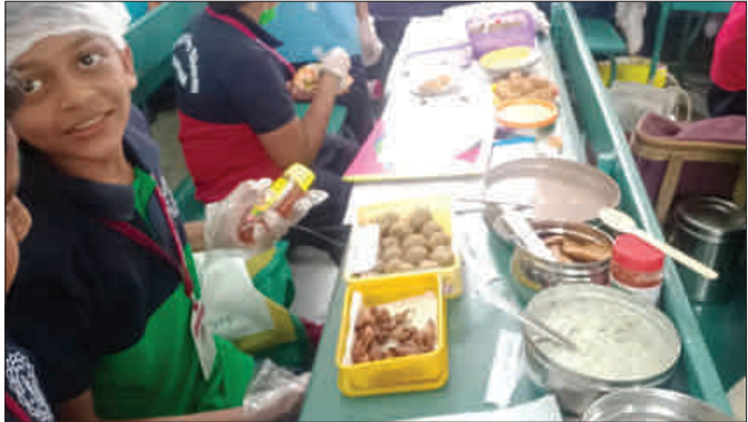
World food day was celebrated on 16.10.2023 by students of class VI by bringing different types of food made out of millets.