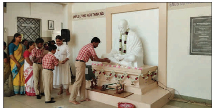
Tribute to the Mahatma

"Only through right education can a better order of society be built up." - Pandit Jawaharlal Nehru