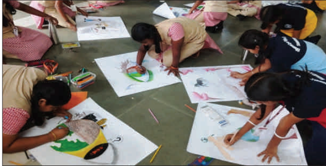
The Inter school drawing competition was conducted by the LIONS INTERNATIONAL on 10.10.23. The best paintings are selected and sent to the next level competition.

“What we really are matters more than what other people think of us.”- Jawaharlal Nehru