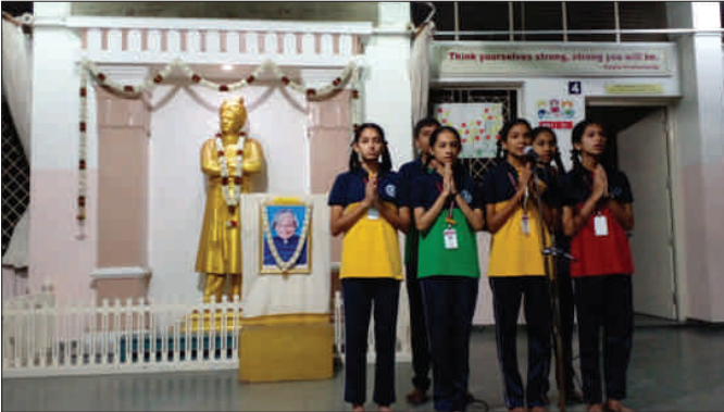
Tribute to the Missile man' on his birthday.