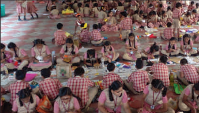
Inter House Competition held on 21.10.2023