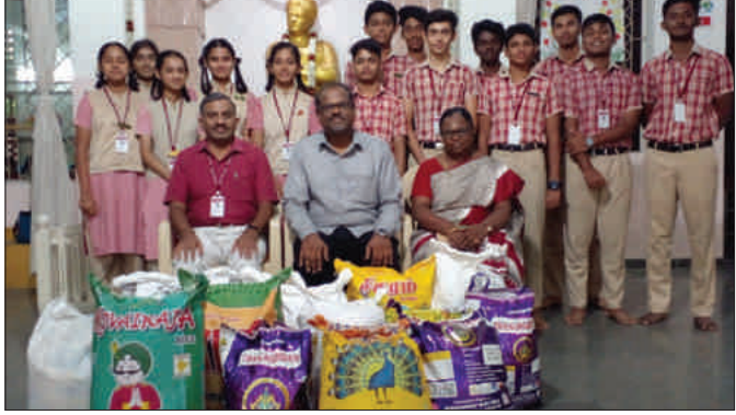
Food grains, fruits, biscuits and breads were distributed to the needy people by the students through shanthi ashram.