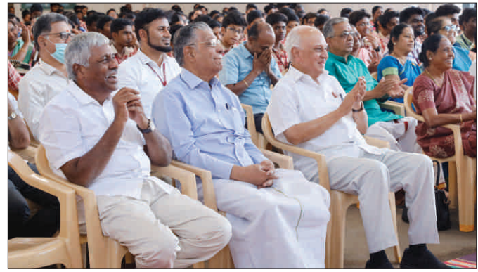
மகிழ்ச்சியில் திளைத்த ஆன்றோர்கள்