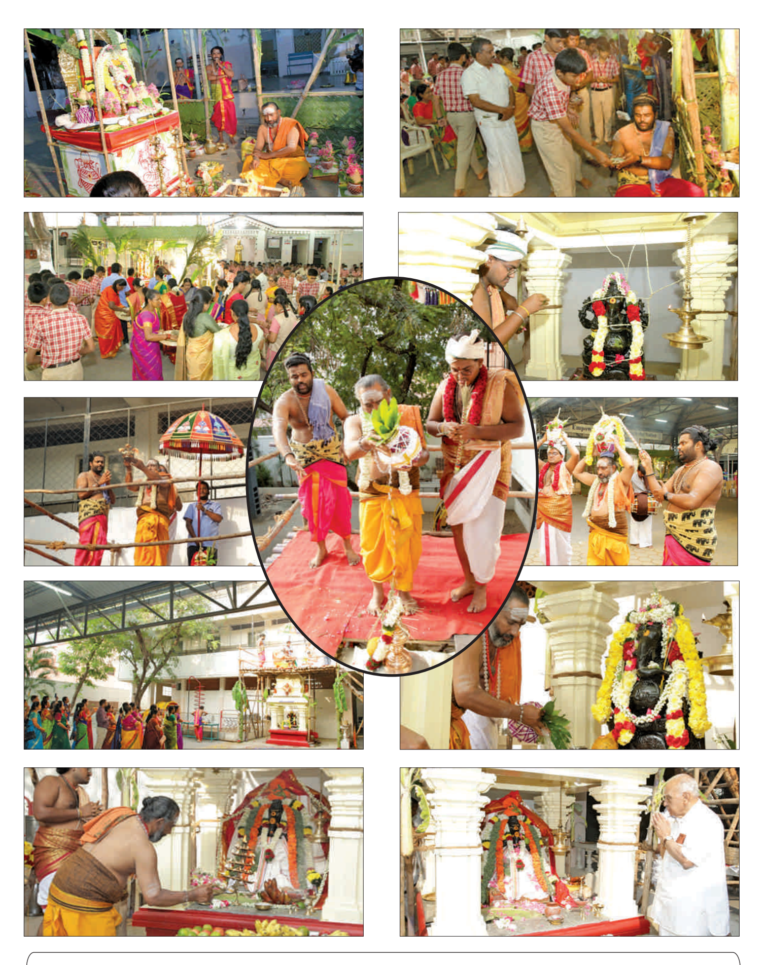
Never Stop Praying, even after God gave you what you were Praying for.