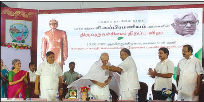
The Chairman being honoured at the function