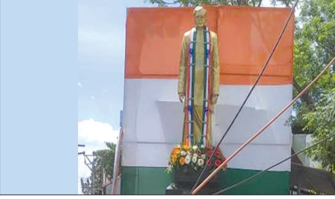
The Majestic Statue