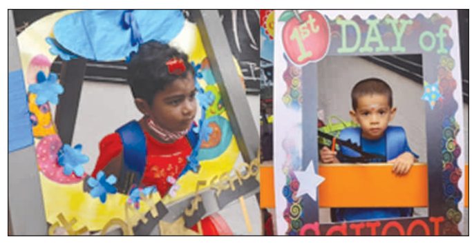
Children enjoying at "selfie corner"