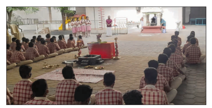
School reopening day pooja