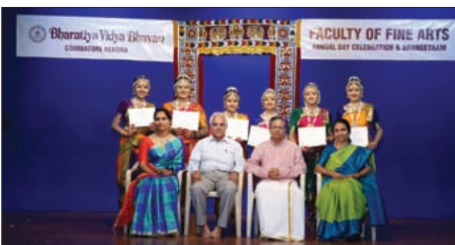
Final year diploma students with the chief guest and other dignitaries