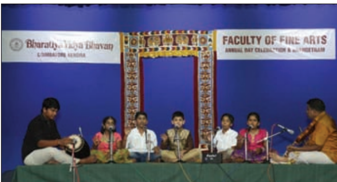
Vocal music by the Certificate course students