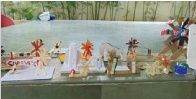
A few models of the charkha, prepared by students

The 150th birth anniversary of Mahatma Gandhi was celebrated on 3rd October 2019. There were speeches in English, Tamil and Hindi on the ideals of Gandhi, his contribution towards freedom and his principle - Satyameva Jayathe! The choir rendered heartwarming Bhajans. An oath was administered by the Principal on service to society through truth and non-violence. Models of the charkha, prepared by students were exhibited.