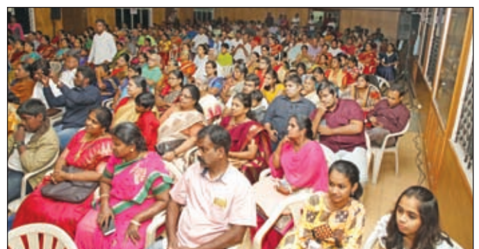
Section of the Audience