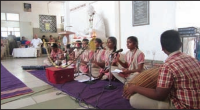
The choir presents the bhajans as the dignitaries look on