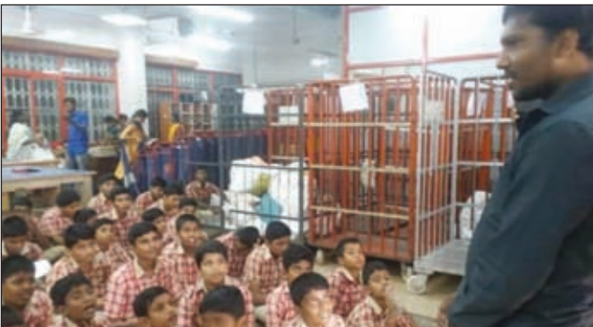
Students listen to the explanation by the officer

15th of October is earmarked as "Mails day". The students of class VIII along with their class teachers visited the R M S office (Railway Mail Service) near Coimbatore Railway station on that day and learnt about the processing of letters stage by stage from posting to the delivery point. All the students were given an inland letter and asked to write a letter to their friends/ relatives.