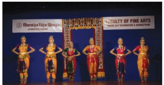
Arangetram of the final year Bharatanatyam students