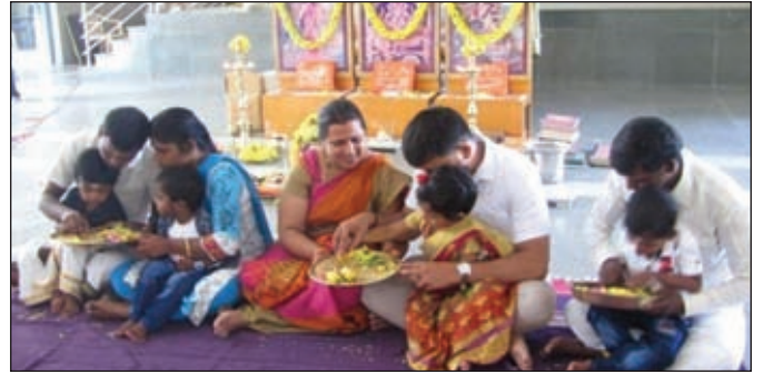
Tiny tots write their first letters on the paddy

On Vijayadashami day, the school conducted 'Vidyarambham' for the fresh beginners with a special puja to Lord Ganesh, Goddess Lakshmi and Goddess Saraswathi. Pre K.G. children were helped to write the letter 'Ohm' and 'அ' on the paddy. Music and dance performances were presented by the 'Fine Arts' students. Later, students offered their respects to their gurus.