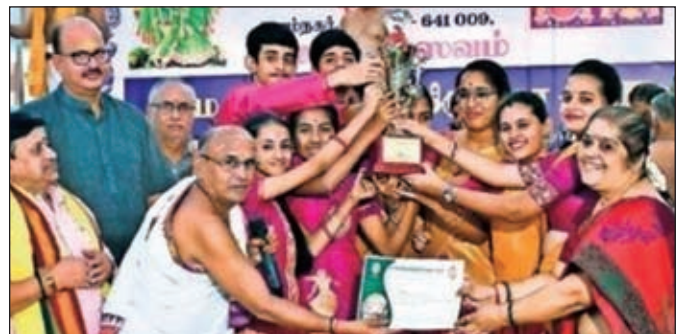
Jubilant students hold aloft the trophy.

Namasankeerthana trust conducted a district level Bhajan competition on 11.10.19 at Ayyapan Puja Sangam, Ramnagar, Coimbatore. Students from reputed schools with a strong base in our culture and tradition participated with great zeal. The students from R S Puram B V B came out winners with their energetic and vibrant performance.