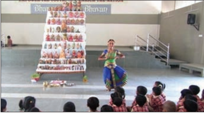
A student performs bharamatanatyam in front of the kolu

The auspicious nine-day Navaratri festival began with great fervour at BVB, Ajjanur on 29th September, 2019. Students from K.G classes to XII visited the kolu everyday to seek the blessings of the Almighty. Students propitiated the deities with devotional songs and bharamatanatyam performances. Prasadham was distributed at the end of each day's programme.