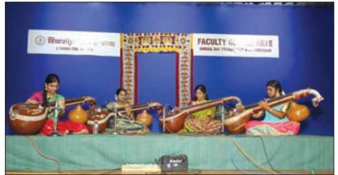
Veena performance by first year diploma students