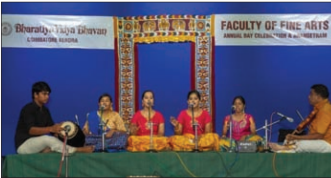
Vocal performance by the final year diploma students