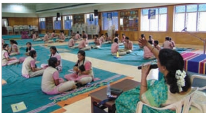
Art of living session in progress