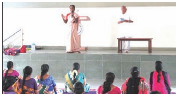
Teachers' yoga session