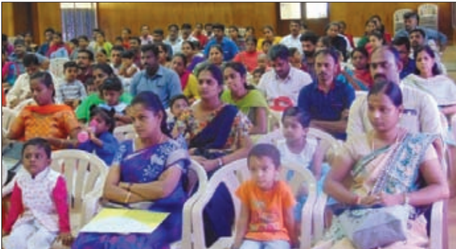
A section of the parents attending the meeting