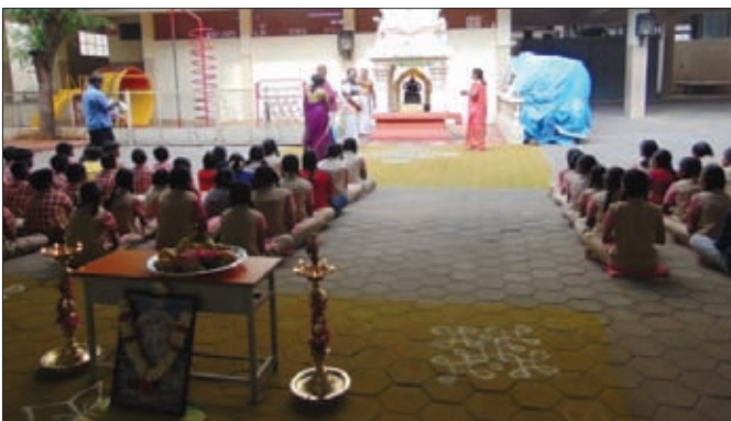
Prayer to Brahma Vidya Ganapathy