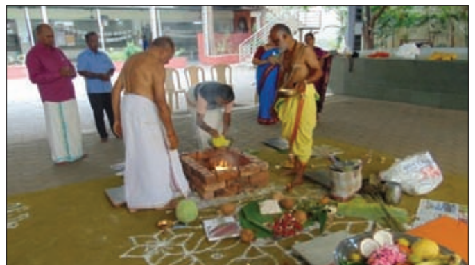
A homam is being performed

“Be the parent today that you want your kids to remember tomorrow.”