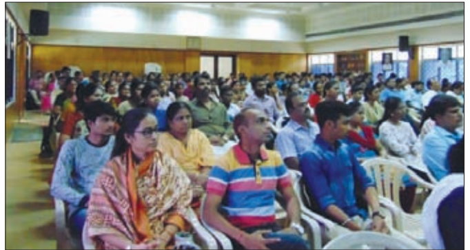
A section of the audience