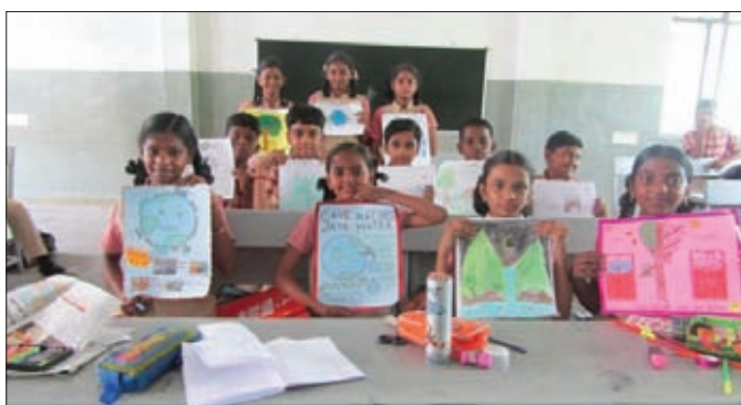
Students with their posters

Various competitions were held at BVB, Ajjanur for students of classes V to IX on 7.6.2019 in connection with World Environment Day. The topics were: