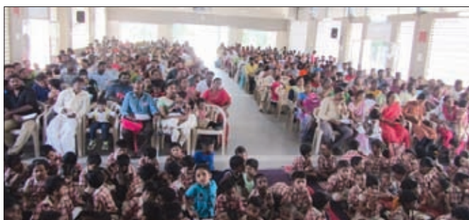
Students and parents