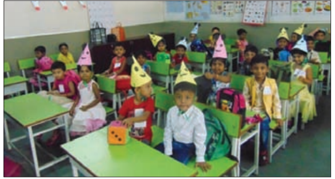
Tiny tots with colourful caps