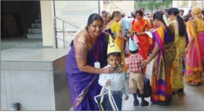
Students welcomed by teachers