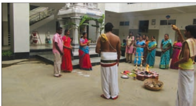
Opening Day Puja

Inaugural Pooja was conducted on 3rd June 2019. Students and teachers participated and received the blessings of the Almighty.