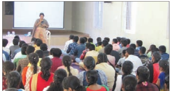
'Yes' programme for class 10