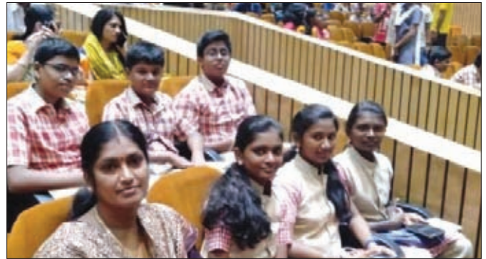
At the 10th National Integration Camp

Six students and an escort teacher attended the 10th NATIONAL INTEGRATION CAMP, organised at K.M.Munshi Marg, Jaipur from May 12, 2019 to May 17, 2019, to promote harmony and national integration among students. 'Together we are Magical' was the theme of NIC 2019. Children showcased their talents through cultural programme and exhibition in the camp. The camp was attended by more than 500 students belonging to 58 schools.