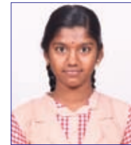
Mahalakshmi A 576 / 600