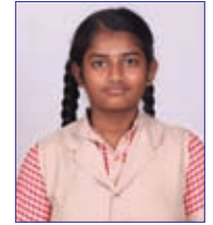
Niveda M 580 / 600