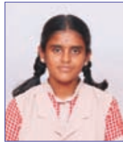
Anusri P 558 / 600