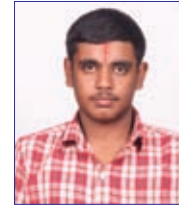
Dwarakesh M 580 / 600