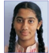
Miridula S 564 / 600