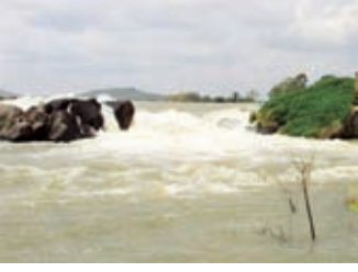
நொய்யலாறு கரை புரண்டோடும் போது