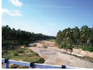
வறண்டு கிடக்கும் போது