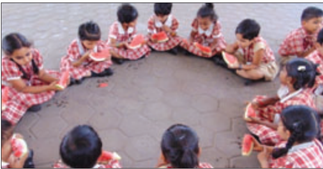
Children are enjoying water melon on Watermelon Day