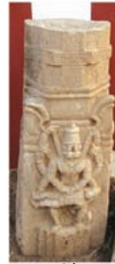
நரசிம்ம அவதார சிற்பம்

அர்த்த மண்டபத்தின் கற்சுவற்றின் வெளிப்பக்கத்தில், பழங்காலத்திய தமிழ் எழுத்துக்களில் பொறிக்கப்பட்ட வார்த்தைகள் பல இடங்களில் காணப்படுகின்றன. இந்தக் கோயில் தூண்கள், சிதிலமடைந்திருக்கும் இந்தக் கோயிலின் 1200 ஆண்டு காலத் தொன்மையை, உன்னத, பொற்காலப் பெருமையை, மௌனமாய் விளக்குகின்றன. இந்தக் கற்தூண்களில் தசாவதாரங்களைக் காட்டும் சிலைகள் வடிக்கப்பட்டுள்ளன. இந்த ஆலயத் திருக்குளம் இரண்டு ஏக்கர் பரப்பளவில் இருக்கிறது.