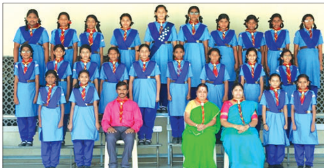
A group photo of the Guides after the Lighting Ceremony.