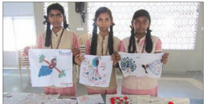
Needle Craft Day

Sandwich Day. The primary students had Needle Craft Day, Lighting Ceremony of Scout & Guides, Graduation Day and Quiz Day.