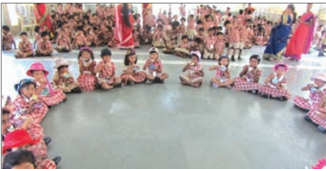
Fruit salad day

Kindergarten students at Ajjanur, completed their academic year with fun filled days engaged in various activities. They had Fruit salad Day and