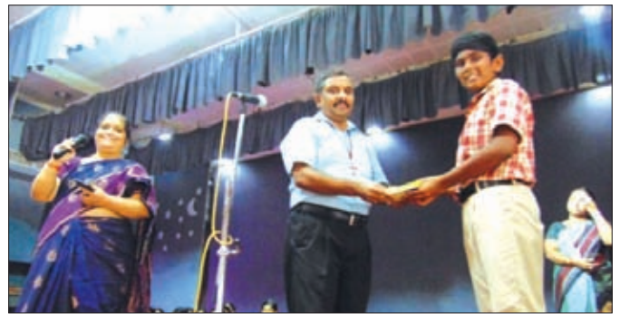
A student is being felicitated for his 100% attendance