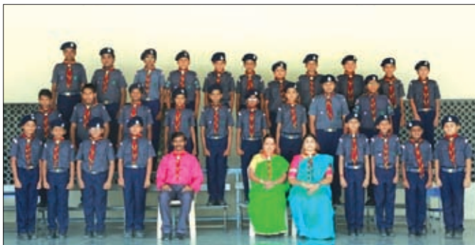
A group photo of the Scouts after the Lighting Ceremony.