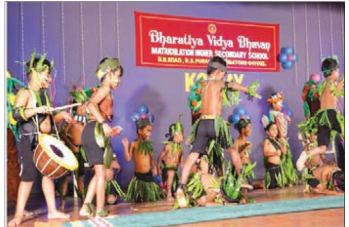
Tribal dance in progress